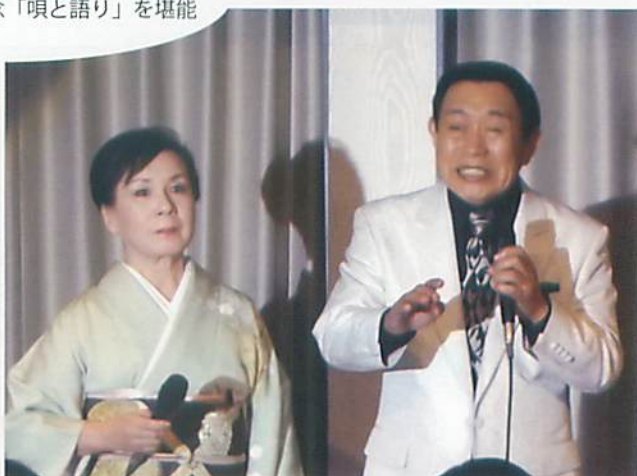
藤村さん (高20) とデュエットを唄う