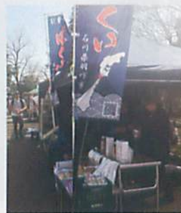
ボランティア募集中

kitajima-milk@c08.itscom.net katsuyoshi-kitajima@ezweb.ne.jp