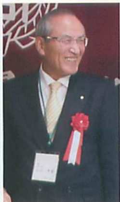
羽咋市長 山辺 芳宣 様 (高11)